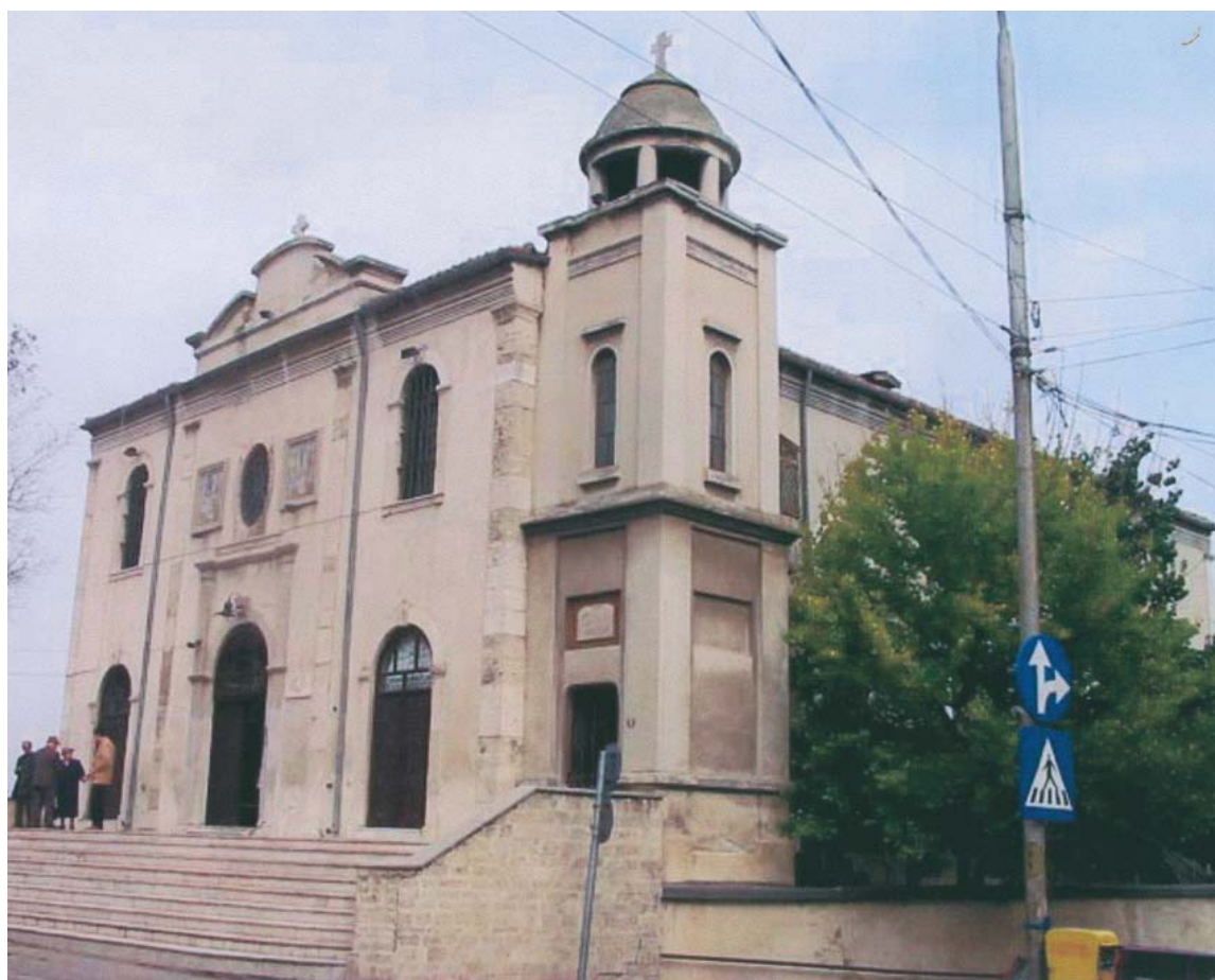
BISERICA GREACĂ A COMUNITĂȚII ELENE DIN CONSTANȚA Ctitorită începând din martie 1866, fiind aprobată și recunoscută de domnitorul Alexandru Ioan Cuza prin decret domnesc nr. 272 din 21 martie 1863. Sfințită la 6 august 1872 cu hramul SCHIMBAREA LA FAȚĂ - ΜΕΤΑΜΟΡΦΩΣΗΣ ΤΟΥ ΣΟΤΗΡΙΟΥ